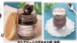
カシスジャムの店おあた様(深田)